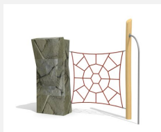
KL.006.1 Arche naturelle 240 cm