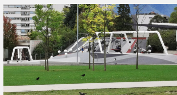
FS.050.22 Granulés en caoutchouc EPDM 220