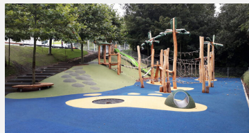
FS.050.30 Granulés en caoutchouc EPDM 300