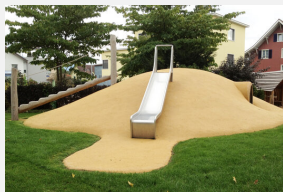
FS.050.10 Granulés en caoutchouc EPDM 100