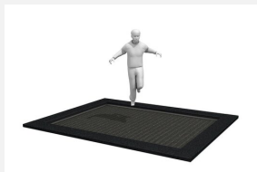
FA.091.1 Trampoline XL à enterrer