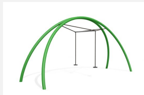
FA.030M.C bimbo Balançoire double Arc en métal color