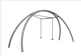
FA.030M bimbo Balançoire double Arc en métal