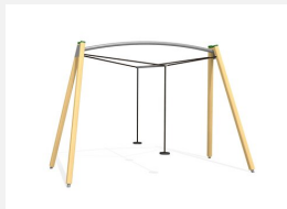
FA.030 bimbo Balançoire double