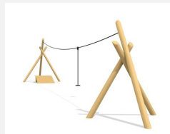
FA.022.2.R Tyrolienne avec rampe