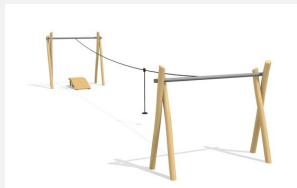
FA.020.2.R Tyrolienne avec rampe robinier