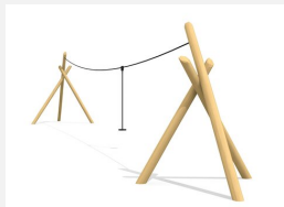
FA.022.1.R Tyrolienne sur une colline