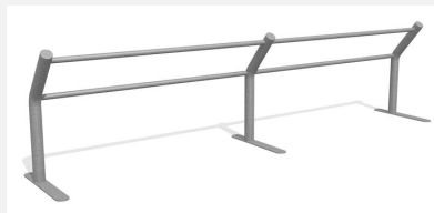
DI.031.40 Kickbar 2, 400 cm