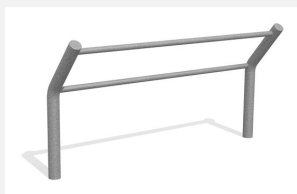
DI.032.20 Kickbar 3, 200 cm