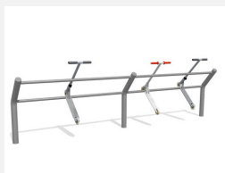
DI.032.40 Kickbar 3, 400 cm