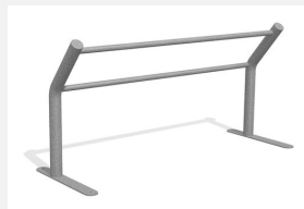
DI.031.20 Kickbar 2, 200 cm