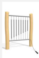
DI.021.1.R Tubes de sonorité - nature