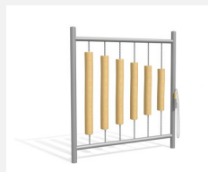
DI.021.3 Bois de sonorité