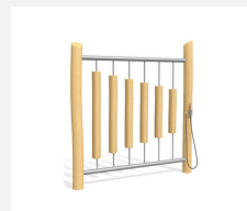
DI.021.3.R Bois de sonorité - nature