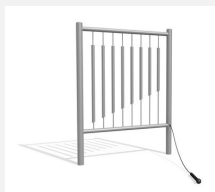
DI.021.1 Tubes de sonorité