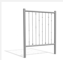
DI.021.2 Barres de sonorité