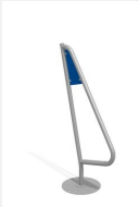
C315.20 Le surfeur mobile