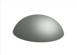
C101.06 Der Berg 50 cm