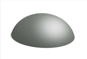
C101.08 Der Berg 100 cm