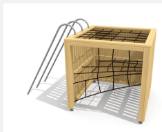
BX.120.2 bimbox dé à grimper GAS