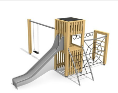
BX.100.1 bimbox tours à grimper HAM avec 1 balançoire