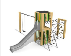
BX.100.1.L bimbox tours à grimper HAM, balançoire - lasuré