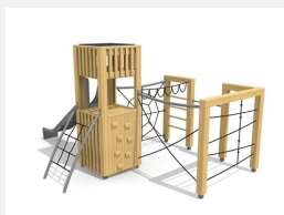
BX.101 bimbox tours à grimper BURG