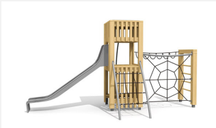
BX.100 bimbox tours à grimper HAM