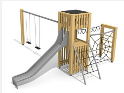
BX.100.2 bimbox tours à grimper HAM avec 2 balançoire