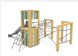
BX.101.L bimbox tours à grimper BURG - lasuré