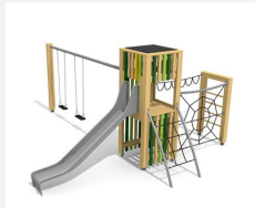
BX.100.2.L bimbox tours à grimper HAM avec 2