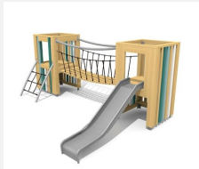
BX.060.2.L Village de jeux PE - lasuré