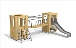
BX.060.2 Village de jeux PE