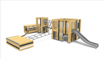
BX.060.4.L Village de jeux KING - lasuré