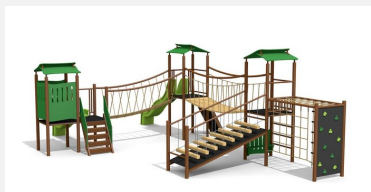
BS.130.MC Paysage à grimper 4 steel color