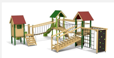
BS.130.L Paysage à grimper 4 - lasure en couleur