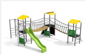
BS.120.M Paysage à grimper 3 steel