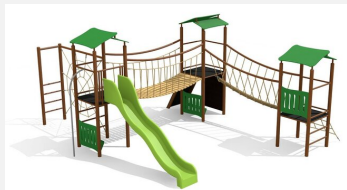
BS.120.MC Paysage à grimper 3 steel color