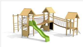
BS.120 Paysage à grimper 3