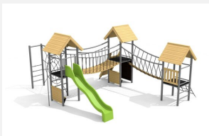
BS.120.HM Paysage à grimper 3 classic steel