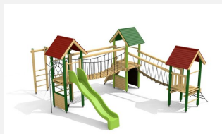
BS.120.L Paysage à grimper 3 - lasure en couleur