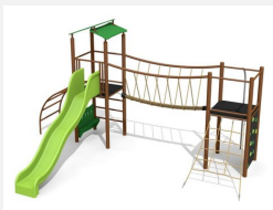
BS.100.MC Paysage à grimper 1 métal steel