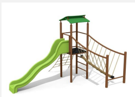
BS.100.1.MC Paysage à grimper 1 sur une colline steel color