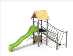
BS.100.1.HM Paysage à grimper 1 sur une colline classic steel