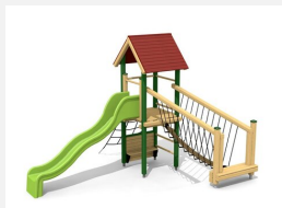
BS.100.1.L Paysage à grimper 1 sur une colline, lasure coul.