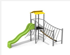
BS.100.1.M Paysage à grimper 1 sur une colline steel