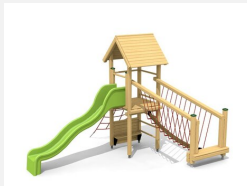
BS.100.1 Paysage à grimper 1 sur une colline