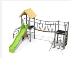
BS.100.HM Paysage à grimper 1 classic steel