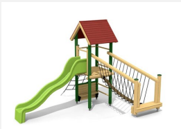
BS.100.1.L Paysage à grimper 1 sur une colline, lasure coul.