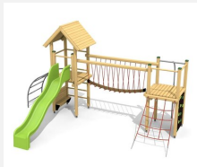
BS.100 Paysage à grimper 1