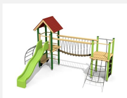
BS.100.L Paysage à grimper 1 - lasure en couleur