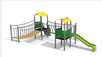
BS.040.2.M Grand village de jeux 2 avec colline steel