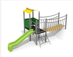
BS.040.1.M Village de jeux 2 avec colline steel