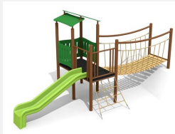
BS.040.1.MC Village de jeux 2 avec colline steel color