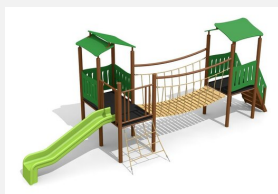
BS.040.MC Village de jeux 2 steel color