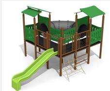
BS.030.2.MC Village-grotte steel color