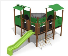
BS.030.2.MC Village-grotte steel color