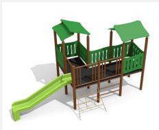
BS.030.MC Village de jeux 1 steel color