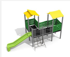
BS.030.M Village de jeux 1 steel