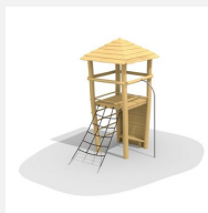
BN.070.01.C Affût perché toit à 4 pans