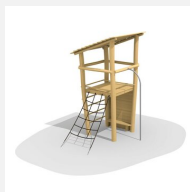
BN.070.01.B Affût perché toit à 1 pan