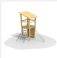
BN.070.02.B Affût perché, barres de glisse et