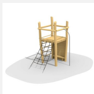
BN.070.01.A Affût perché sans toit