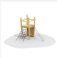
BN.070.02.A Affût perché avec barres de glisse