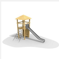
BN.070.04.C Affût perché avec toboggan inox,