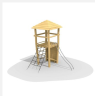
BN.070.02.C Affût perché, barres de glisse et