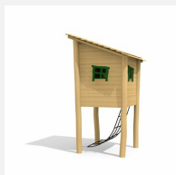
BN.064.01.B Cabane à filet toit à 1 pan