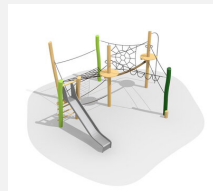
BN.023.15.L Paysage de cordes 15 - lasuré