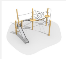
BN.023.15 Paysage de cordes 15