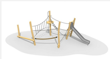
BN.023.13 Paysage de cordes 13