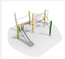
BN.023.15.L Paysage de cordes 15 - lasuré