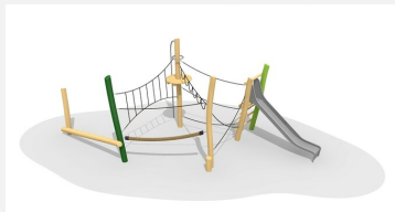
BN.023.13.L Paysage de cordes 13 - lasuré