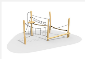
BN.022.3 Paysage de cordes 3