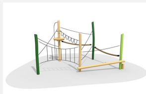
BN.022.3.L Paysage de cordes 3 - lasuré