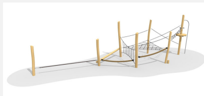
BN.022.5 Paysage de cordes 5