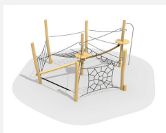
BN.022.7 Paysage de cordes 7