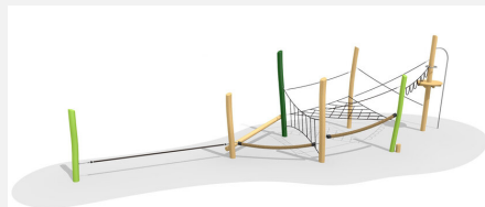
BN.022.5.L Paysage de cordes 5 - lasuré