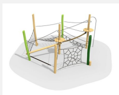
BN.022.7.L Paysage de cordes 7 - lasuré