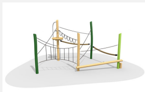
BN.022.3.L Paysage de cordes 3 - lasuré