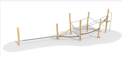
BN.022.5 Paysage de cordes 5