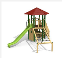
BM.070.1.L Tour à grimper Hagendorn 1 -