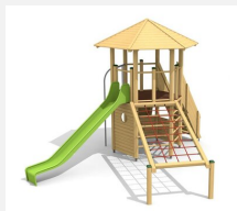
BM.070.1 Tour à grimper Hagendorn 1