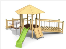
BM.070.3 Tour à grimper Hagendorn 3