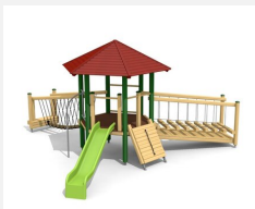
BM.070.3.L Tour à grimper Hagendorn 3 - lasure