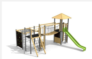
BM.060.1.M Complexe de jeux Stans classic steel