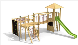
BM.060.1 Complexe de jeux Stans