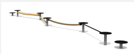
BA.052.4.C bimbo école d'équilibre 4 - color