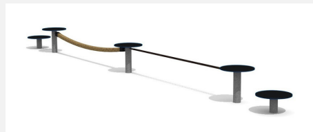
BA.052.2.C bimbo école d'équilibre 2- color