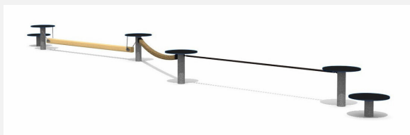
BA.052.3.C bimbo école d'équilibre 3 - color