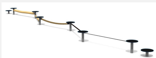
BA.052.5.C bimbo école d'équilibre 5 - color