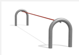
BA.051 Corde d'artiste bimbo