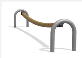
BA.050 Corde de jungle bimbo