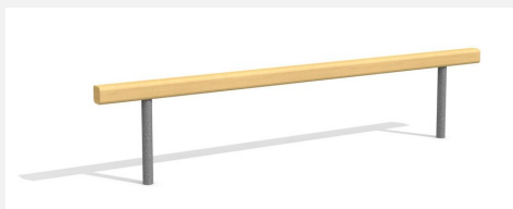
BA.020.6 Poutre d'équilibre plane 60 cm