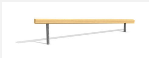
BA.020.1 Poutre d'équilibre inclinée 30-60 cm