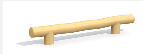
BA.020.3.R Poutre d'équilibre plane 30 cm - nature