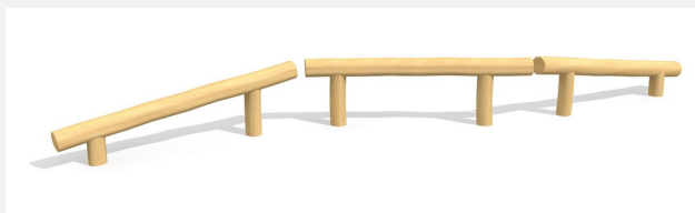
BA.021.R Poutre d'équilibre - montagne et vallée nature