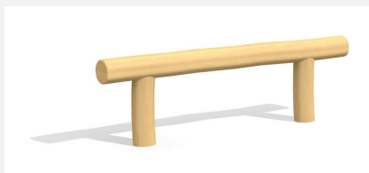
BA.020.6.R Poutre d'équilibre 60 cm - nature