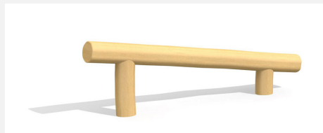
BA.020.1.R Poutre d'équilibre inclinée 30-60 cm - nature