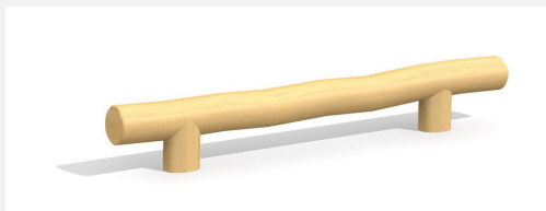
BA.020.3.R Poutre d'équilibre plane 30 cm - nature