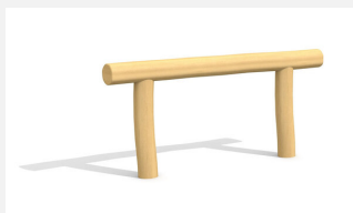
BA.020.9.R Poutre d'équilibre plane 90 cm - nature