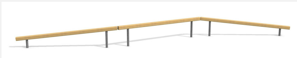
BA.021 Poutre d'équilibre - montagne et vallée