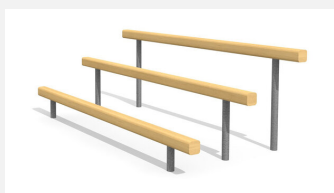
BA.022 Le pas de l'ours