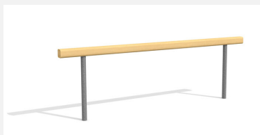
BA.020.9 Poutre d'équilibre plane 90 cm