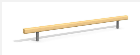
BA.020.3 Poutre d'équilibre plane 30 cm