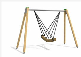
SC.084.3 Balançoire viking