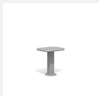
SWC.4965 Jump Platform 500