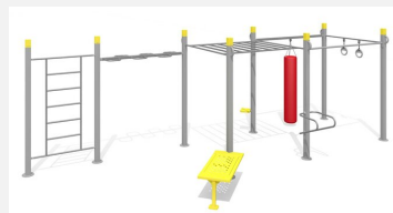
SWC.4967 HIT Training 967