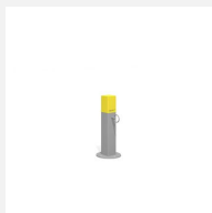
SWC.4962 Bootcamp Rope pole