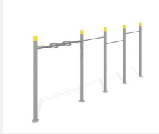
SWC.4462 Streetworkout 462