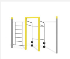
SWC.4459 Streetworkout 459