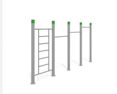
SWC.4463 Streetworkout 463