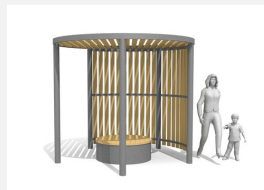
WS.200.90 Pavillon Cubo wood nach Mass