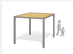
WS.200.1 Pavillon Cubo wood 1